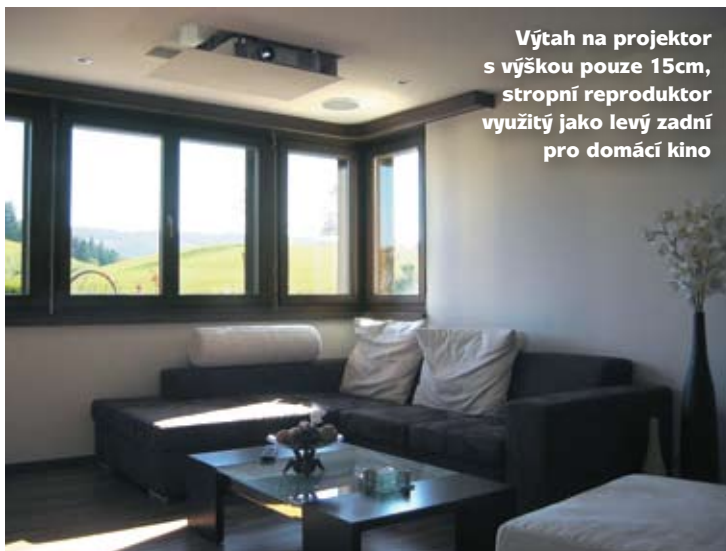
Výtah na projektor s výškou pouze 15cm, stropní reproduktor využitý jako levý zadní pro domácí kino