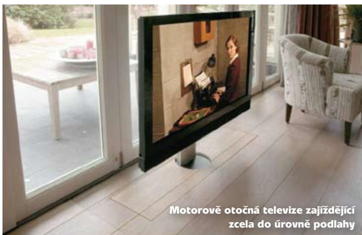
Motorově otočná televize zajiřďující zcela do úrovně podlahy