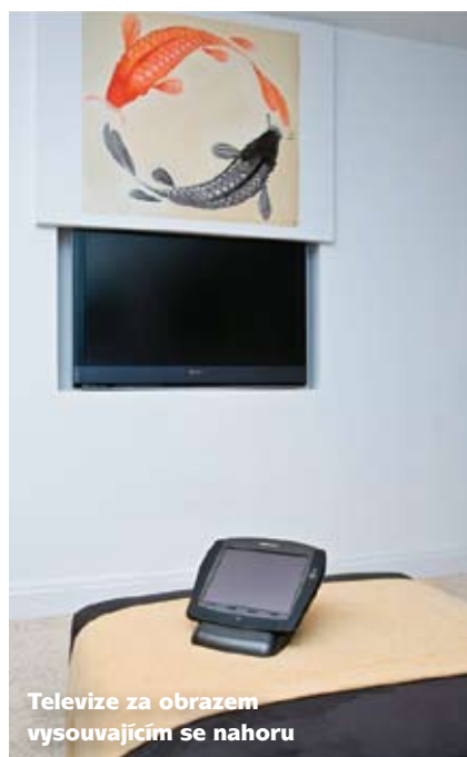
Televize za obrazem vysouvajícím se nahoru

hým motorem samostatně ovládanou krycí klapku, která zajede do stolu ještě před započítím výsuvu televize), výškou maximálního výsuvu, velikostí a nosností mechanismu výtahu, tichostí a rychlostí chodu, přesností dosažené polohy při vysunutí (podstatné zejména u výtahů pro projektory, aby byl promítaný obraz na plátně vždy na přesně stejné pozici). Důležité je i jak je myšleno na vedení všech potřebných kabelů a jak lze výtah ovládat - ideálně by se vše mělo dít zcela automaticky, včetně dodržení potřebného času pro ochlazení lampy projektoru před zasunutím zpět do stropu.