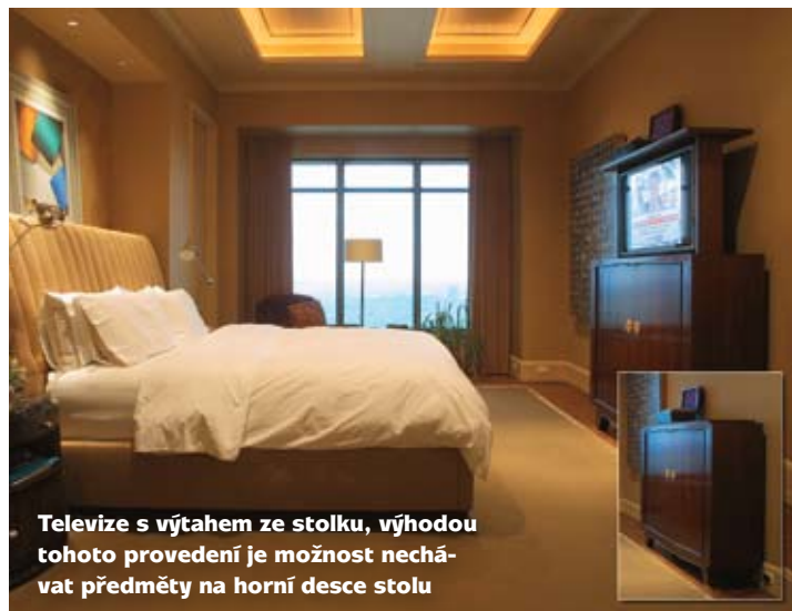
Televize s výtahem ze stolu, výhodou tohoto provedení je možnost nechávat předměty na horní desce stolu